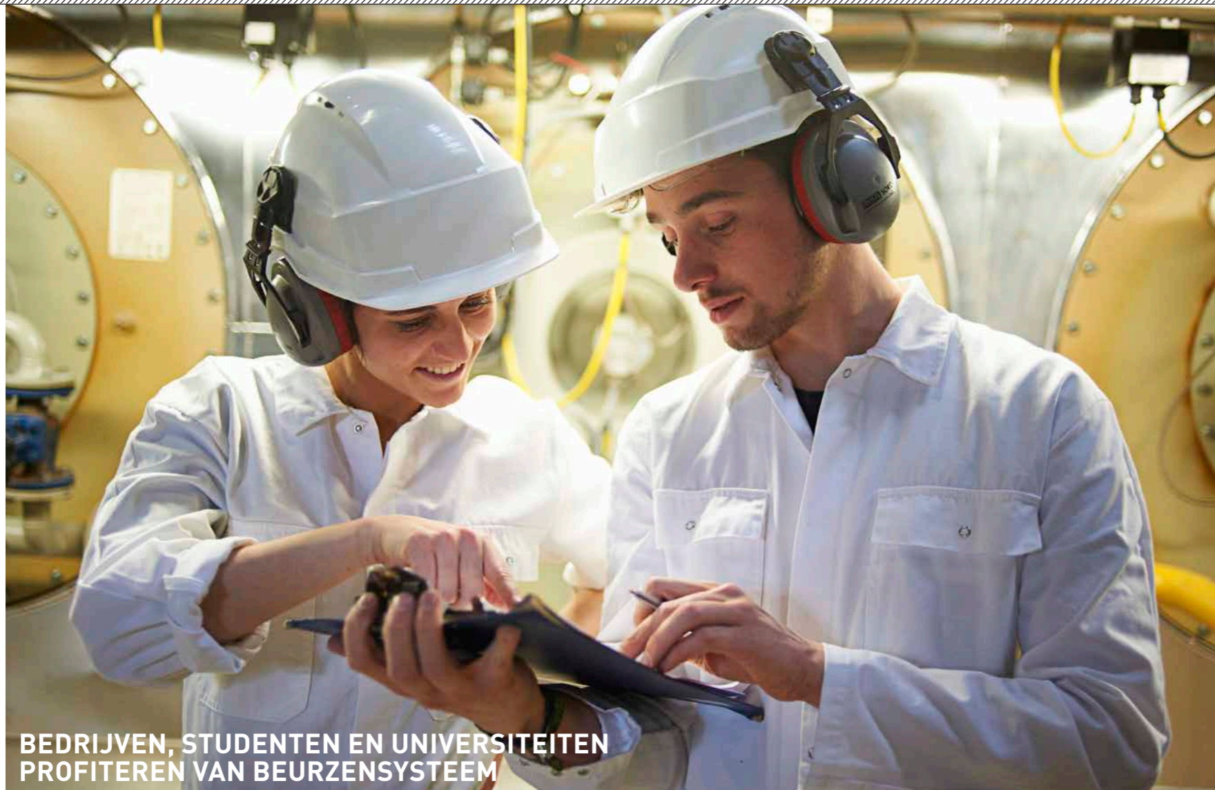
BEDRIJVEN, STUDENTEN EN UNIVERSITEITEN PROFITEREN VAN BEURZENSISTEEM